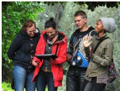
Genom Loquiz får du omedelbart starkt engagerade deltagare, perfekt bland annat vid utbildningar och kick offer

Loquiz är en plattform för att på ett enkelt sätt skapa event för exempelvis team building-aktiviteter. För att delta krävs endast en fungerande mobiltelefon typ Iphone, Android eller Ipad med GPS-anslutning. Frågorna och själva eventet gör du själv i Loquiz Pro. Placera ut frågorna på kartan och ange förutsättningar som till exempel hur lång tid ditt event ska ta, hur stort område deltagarna ska röra sig inom och hur många poäng varje rätt svar ska generera.