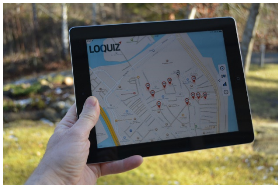
Deltagarna behöver endast en fungerande Iphone, Ipad eller Android