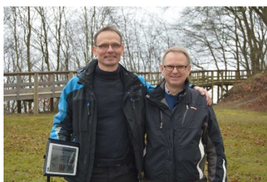
Nordiskt Loquiz team

En fråga var bemannad med en representant från Naturstyrelsen. Syftet med denna fråga var att informera om vad som händer om utryckningsfordon behöver ta sig in på området. När lagen fått informationen fick de en kod som matades in som frågans svar.